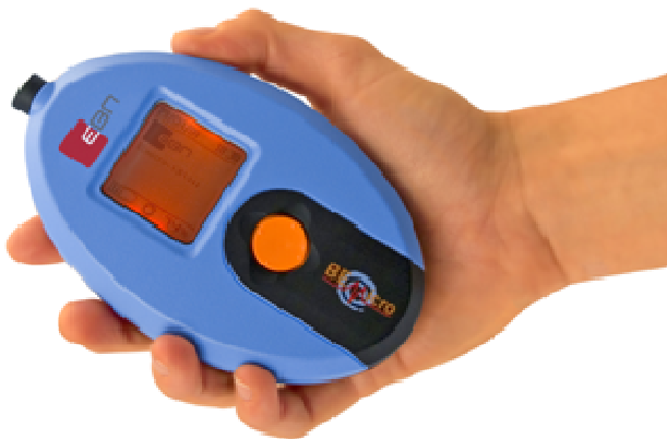
EEG solution now in your hand